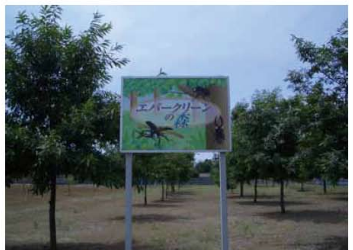
植樹活動「エバークリーンの森」

当社は、今後もISO規格の強化、環境保全対策や環境 技術開発などを推進し、循環型社会の確立を目指す環 境経営に更に取り組みで参ります。